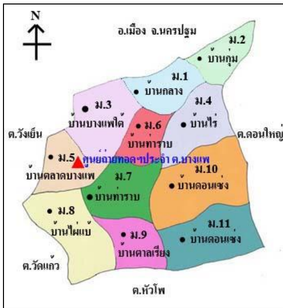
ตำบลบางแพ